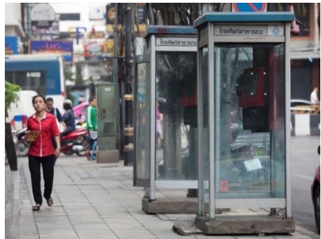
ตู้โทรศัพท์สาธารณะ