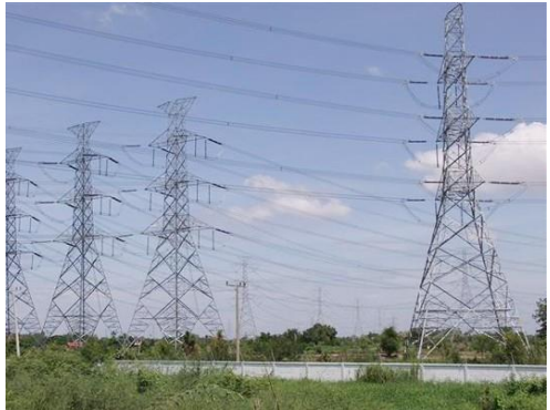
เสาไฟฟ้า