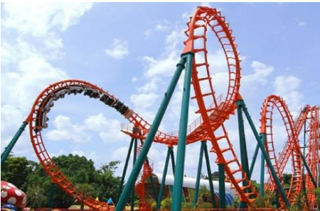
เครื่องเล่นในสวนสนุก