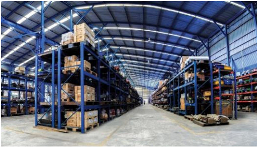
คลังสินค้า