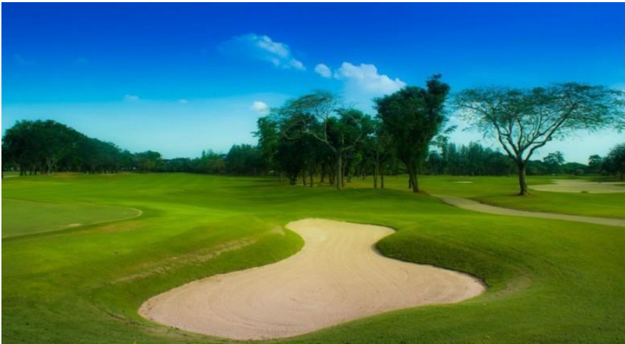
สนามกอล์ฟจัดเป็นธุรกิจการกีฬา จึงได้รับการลดภาษี

๑.๔. ลดภาษีร้อยละ ๙๐ ของจำนวนภาษีที่จะต้องเสียของทรัพย์สินที่ใช้เป็น สถานที่เล่นกีฬา สวนสัตว์สวนสนุก หรือที่จอดรถสาธารณะ