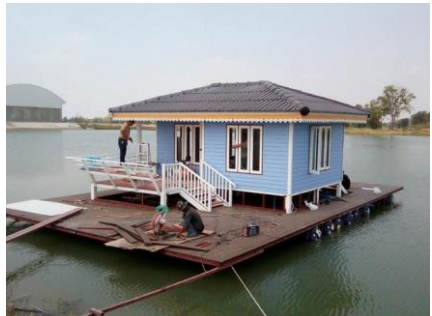
บ้านเรือนอื่นแพ