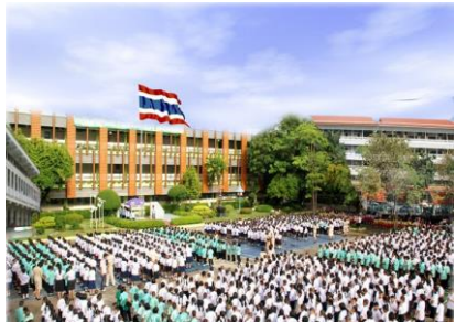
สถานศึกษา