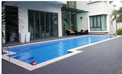
สระว่ายน้ำ