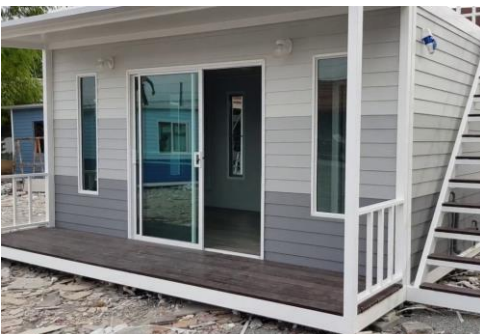
บ้านประกอบเสร็จ