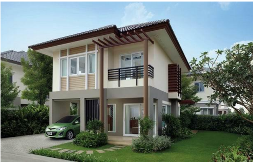
บ้านเดี่ยว

ตัวอย่างสิ่งปลูกสร้างที่อยู่เ็นขายต้องเสียภาษี