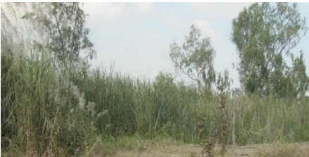
ที่ดินรกร้างไม่ได้ใช้ประโยชน์

(๒) ที่ดินที่ไม่เป็นกรรมสิทธิ์ของบุคคลธรรมดาหรือนิติบุคคล แต่อยู่ในความครอบครองของบุคคลธรรมดาหรือนิติบุคคล เช่น สปก. ๔, ก.ส.น., ส.ค.๑, นค.๑, นค.๓ ส.ที่.ก.๑, ก.ส.ที่.ก.๒ก, นส.๒ (ใบจอง) และที่ดินอันเป็นที่ทรัพย์สินของรัฐซึ่งมีการเข้าไปครอบครองหรือทำประโยชน์ ฯลฯ เป็นต้น