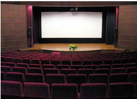
โรงมหรสพ