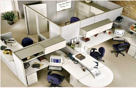
สำนักงาน