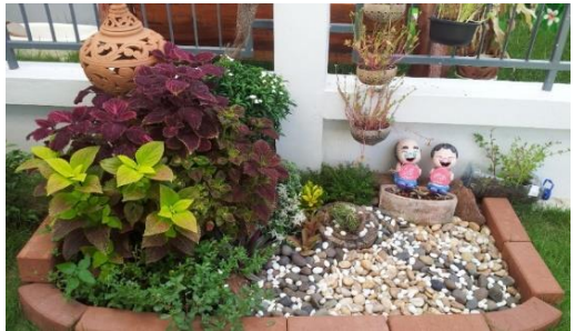
สวนหย่อม