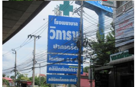
ตัวอย่างป้ายที่ต้องเสียภาษี

หากในกรณีที่ไม่มีผู้มายื่นแบบแสดงรายการภาษีป้ายหรือเจ้าหน้าที่ไม่สามารถติดต่อหรือหาตัวเจ้าของป้ายได้ให้ถือว่าผู้ครอบครองป้ายมีหน้าที่เสียภาษีป้าย แต่ถ้าหาตัวผู้ครอบครองป้ายไม่ได้เจ้าของหรือผู้ครอบครองที่ดินที่ติดตั้งป้ายจะต้องเป็นผู้เสียภาษีป้ายแทน ตามลำดับที่กล่าวมา