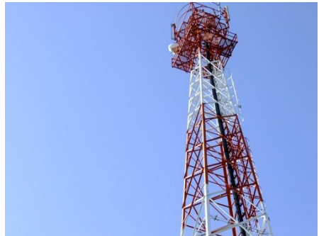
เสาส่งสัญญาณอินเทอร์เน็ต