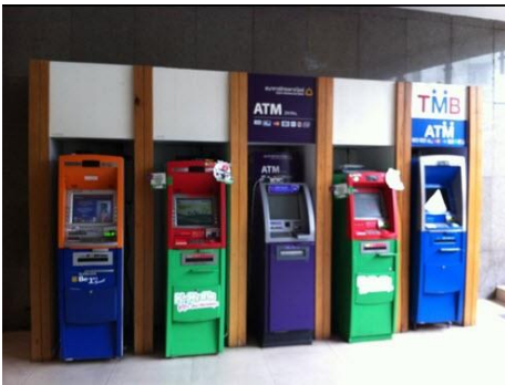
ตู้ฝากถอนเงินสด

ตัวอย่างสิ่งปลูกสร้างที่อยู่ในข่ายได้รับการยกเว้นภาษี