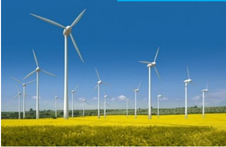
กังหันลม

ตัวอย่างสิ่งปลูกสร้างที่อยู่ในข่ายได้รับการยกเว้นภาษี