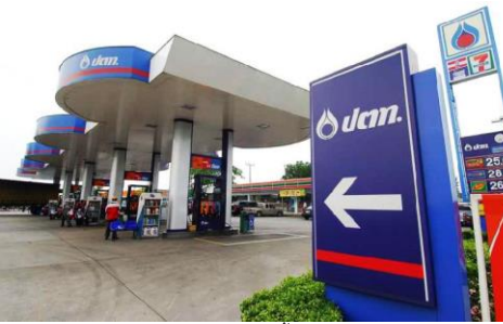
สถานีบริการน้ำมัน