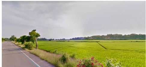
ที่ดินที่ใช้ทำกิจกรรม