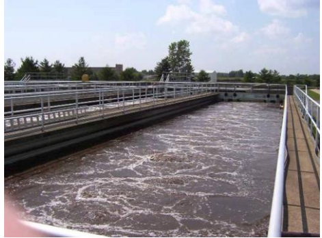
บ่อบำบัดน้ำเสีย