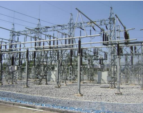
ลานไถไฟฟ้า