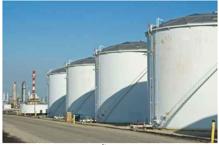
ถังเก็บน้ำมันบนดิน