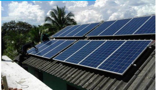
แผงโซลาร์เซลล์