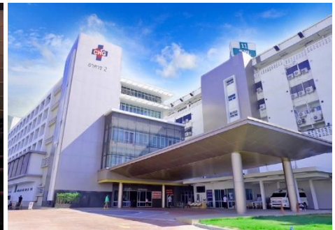
สถานพยาบาล