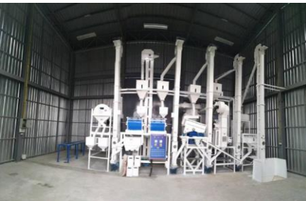
โรงสีข้าว