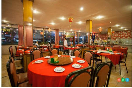
ภัตตาคาร