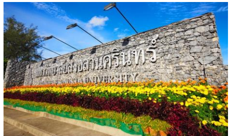
ตัวอย่างป้ายที่ไม่ต้องเสียภาษี